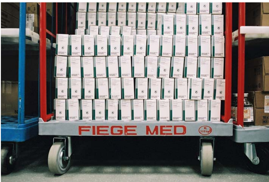
Palet con los artículos una vez finalizado el picking

Ehrhardt + Partner GmbH & Co. KG Sistemas de software para la logística de almacenes Alte Römerstraße 3 D-56154 Boppard-Buchholz ALEMANIA Tel.: (+49) 67 42 / 87 27 0 Fax: (+49) 67 42 / 87 27 50 E-Mail: info@ehrhardt-partner.com Internet: www.ehrhardt-partner.com